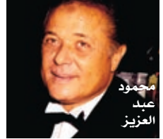
محمود عبد العزيز

وافقت النجمة يسرا على تقديم برنامج تلفزيوني يخرجها مروان حامد وتناقش فيه مجموعة من القضايا التي تدخل ضمن اهتماماتها كسفيرة للأمم المتحدة، ومنها قضايا تخص الأطفال وأخرى تخص العنف والحرية في مجتمعاتنا العربية. وهذه هي التجربة الأولى ليسرا في تقديم البرامج وإن كانت جسدت شخصية مديعة من قبل في مسلسل «لقاء على الهوا». وكانت يسرا تلقت عروضاً كثيرة من قبل لتقديم برامج لكنها كانت تمتد عندها إلا أنها هذه المرة تحمست لفكرة البرنامج لكونه يناقش قضايا مهمة وجادة.