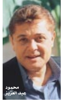
محمود عبد العزيز

بعد ٢٠ سنة على آخر لقاءاتهما نور الشريف ومحمود عبد العزيز في «ليلة البيبي دول» بعد مرور ٢٠ سنة على آخر عمل جمعتهما معاً وهو فيلم «جري الوحوش» ويعود النجمان نور الشريف ومحمود عبد العزيز للعمل معاً من جديد من خلال فيلم «ليلة البيبي دول» بعد أن نجح المنتج عماد الدين أديب في إقناعهما ببطولة الفيلم الذي رصد له ١٥ مليون جنيه ميزانية مبدئية ويجري حالياً ترشيح أسماء لبقية الأدوار فيه. والفيلم كوميدى ذو طابع سياسي ساخر أيضاً حيث يرصد المتغيرات التي طرأت على المجتمع المصري في العشرين سنة الأخيرة.