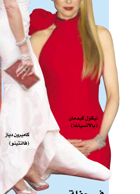
نيكول كيدمان (بالانسيغا)