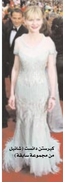
كيرستن دانست (شانيل من مجموعة سابقة)