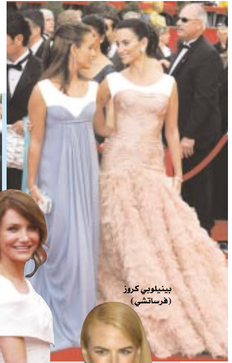
بينيلوبي كروز (فرساتشي)