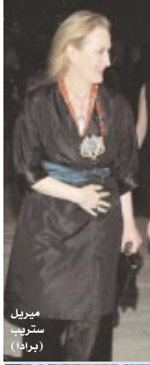
ميريلا سترتيب (برادا)

وكان برنامج الحفل الذي أتفق عليه مع إليسا عبارة عن فقرتين لها والفنان محمد حماقي، لكنها فوجئت بفقرة ثالثة للراقصة دينا، وهو أمر لم تعترض عليه إليسا لكنها قررت الغناء في بداية الحفل عكس المعتاد وقدمت أجمل أغانيها لمدة ٤٥ دقيقة، ليفاجأ منظمو الحفل بمغادرة كم كبير من الجمهور مع إليسا للحصول على توقيعها والتقاط الصور التذكارية. وكانت المطربة اللبنانية اختارت الرد بطريقتها الخاصة على مخالفة شروط التعاقد.