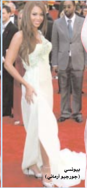
بيونسي (جورجيو أرماني)