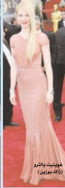
غوينيث بالثرو (زاك بوزين)